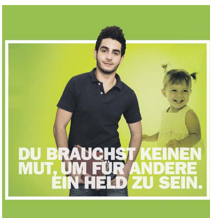
MOTIVATION | So wirbt die AWO für den Bundesfreiwilligendienst

Im Gegensatz zum FSJ ist der BFD (Bundesfreiwilligendienst) für Frauen und Männer jeden Alters und mit einer Dauer von 6 bis 18 Monate eine überwiegend praktische Hilfstätigkeit in Einrichtungen der Wohlfahrts-, Gesundheits- und Altenpflege – wie beim Freiwilligen Sozialen