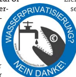
Logo des Bündnisses Berliner Wassertisch

Nun konzentriert sich das Bündnis darauf, die Teilprivatisierung der Berliner Wasserbetriebe aufzuheben. Es ist – nach Offenlegung der Verträge – der Meinung, die Teilprivatisierung sei verfassungswidrig.