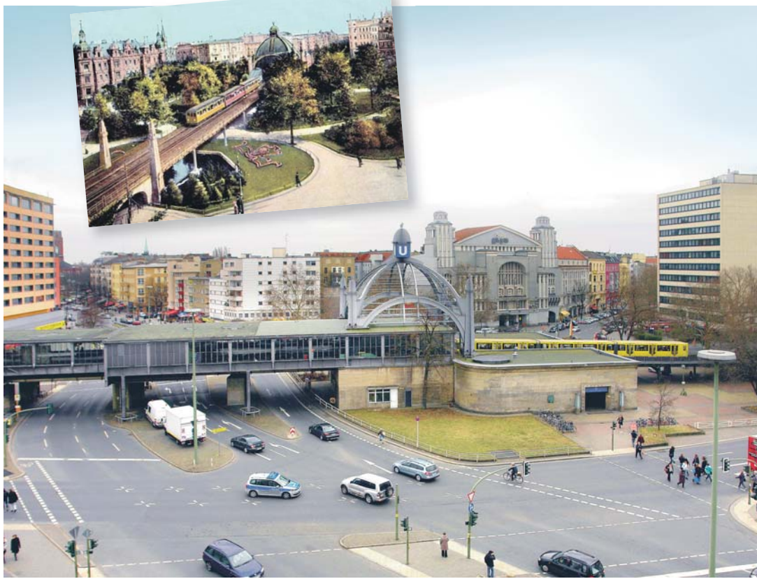
NOLLENDORFFPLATZ | Vom ehemaligen Flair wie auf der Postkarte von 1913 ist nichts mehr zu sehen

Nichts erinnert mehr daran, dass der Nollendorffplatz ursprünglich nach den Vorstellungen des Gartenarchitekten Peter Josef Lenné angelegt wurde. Mehrmals wurde die Fläche grundlegend umgestaltet, zunächst mit dem Bau des U-Bahn-Eingangsbauwerks in der Platzmitte, später mit der grundlegenden Umgestaltung im Sinne der autogerechten Stadt der 50er- und 60er-Jahre. Heute wird das Bild von dieser weitläufigen Verkehrsführung geprägt, die Fläche ist durch unzählige Verkehrsinseln und