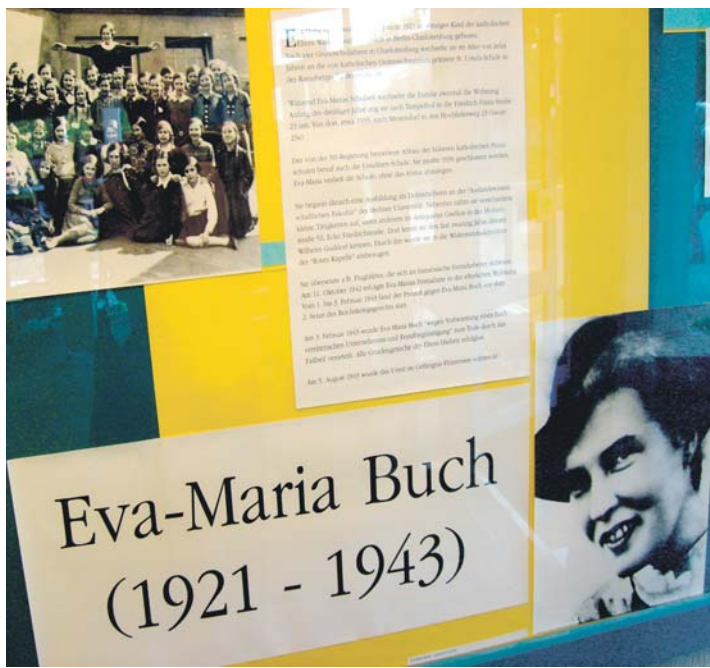
EVA-MARIA-BUCH-HAUS | Blick in die kleine Dauerausstellung