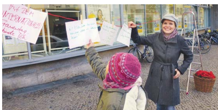
AUFGESCHRIEBEN | Gedanken zum Frauentag

Auch nach über 100 Jahren ist der Frauentag nicht aus der Mode gekommen. Viele alltägliche Ungerechtigkeiten zeigen, wie wichtig es ist, dass der Frauentag weiter begangen wird: Der Lohnunterschied zwischen Männern und Frauen beträgt in Deutschland durchschnittlich 23%, die Führungsetagen in der deutschen Wirtschaft sind immer noch überwiegend mit