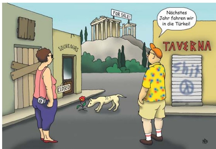
ZEICHNUNG: PETRA RUDOLPHI-KORTE

schlimmsten Befürchtungen für den europäischen Finanzstandort nicht bewahrheitet haben. Glücklicherweise ist man ohne eine flächendeckende Finanztransaktionsteuer auskommen, die ja in der Vergangenheit von mehreren Kommunisten gefordert wurde. Gekonnt wurde auch die Regulierung von Leerverkäufen umschifft, genau wie die Gründung einer europäischen Ratingagentur. Freude kam bei allen Beteiligten auf, als